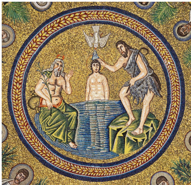
Le Baptême du Christ – Ravenne - Italie